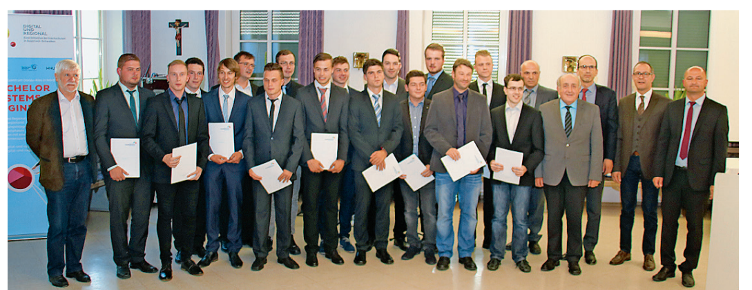
Die Abschlussklasse TMA 2B (oben) und die Klasse TM E2 mit den Ehrengästen