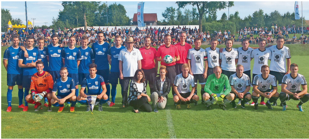
Das Einlagespiel des TSV Wolferstadt (r.) gegen den TSV Rain endete 1:8.

Sieger des Einladungsturniers war die SG Flotzheim-Fünfstetten, die den Lauber SV im Finale besiegte.